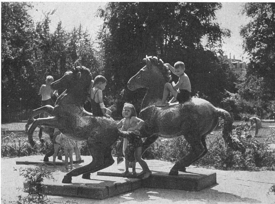
Spielplastiken von Rudolf Wening. Kinderspielplatz Bäckeranlage, Zürich. Gartenbauamt der Stadt Zürich | Sculpture de jeu de Rudolf Wening. Place de jeu pour enfants à Zurich | Play ground sculptures by Rudolf Wening. Children's play ground, Bäckerpark, Zurich