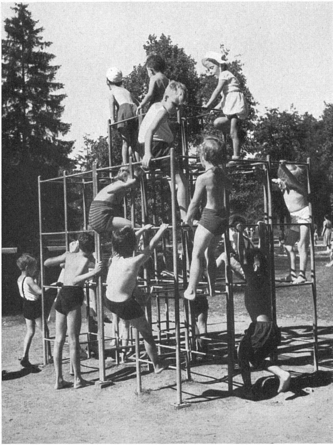
Kletterturm, Schützenmattpark Basel. Stadtgärtnerei Basel | Engin à grimper. Parc de Schützenmatt, Bâle | Climbing tower, Schützenmatt Park, Basle